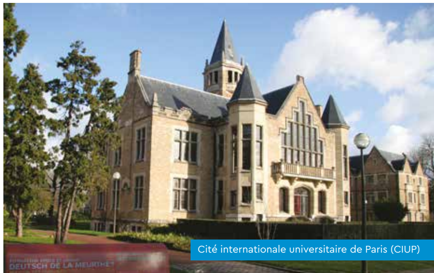
Cité internationale universitaire de Paris (CIUP)

En France, les étudiants de toutes nationalités bénéficient d'aides spécifiques de l'Etat pour se loger. La France est le seul pays d'Europe à offrir un tel dispositif.